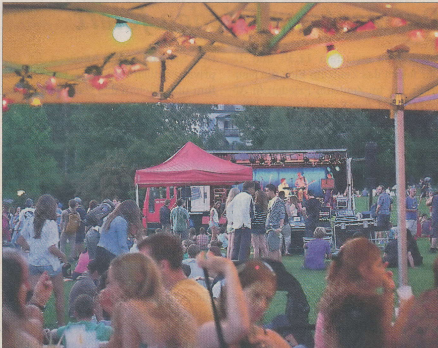
Das Open Air Bounce Bounce lockt um die 800 Besucher an.